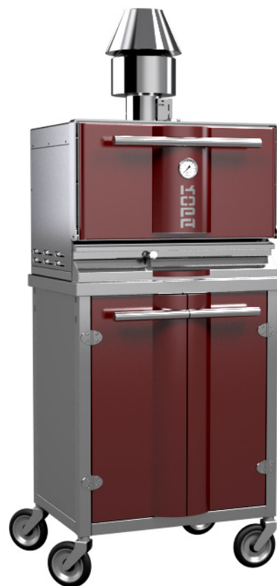
* Tip 300SW na kolesih

Dodatna rešetka za pečenje Dodatne klešče Jeklena ščetka Stranski polici