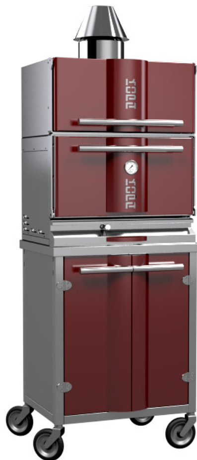
* Tip 300SWC na kolesih

Dodatna rešetka za pečenje Dodatne klešče Jeklena ščetka Stranski polici