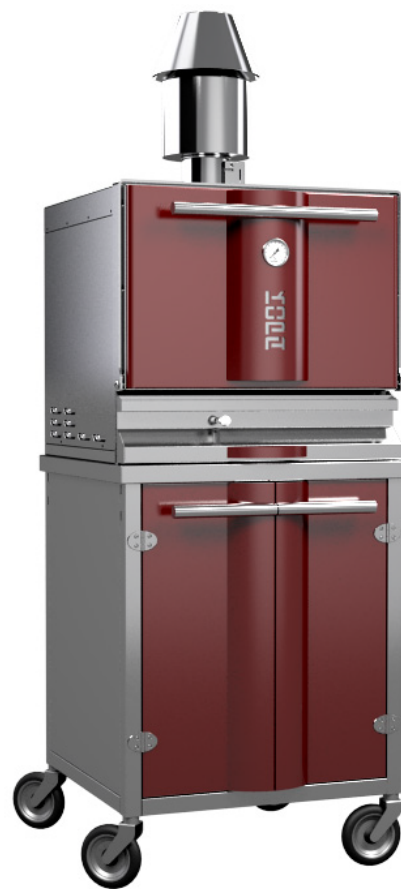
* Tip 400SW na kolesih

Dodatna rešetka za pečenje Dodatne klešče Jeklena ščetka Stranski polici