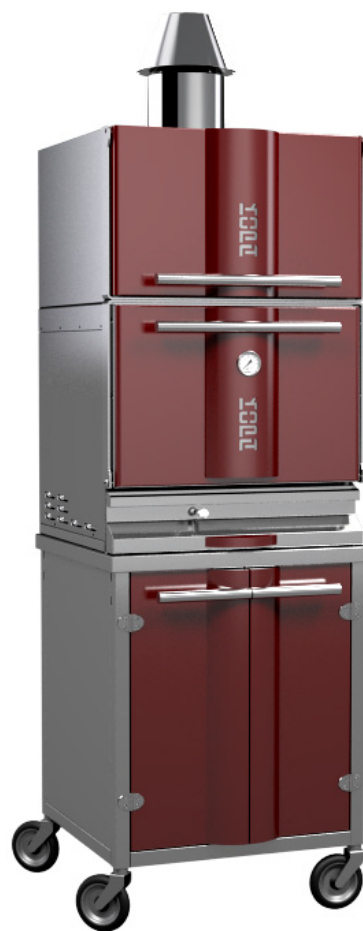
* Tip 400SWC na kolesih

Dodatna rešetka za pečenje Dodatne klešče Jeklena ščetka Stranski polici